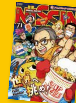
アニュアルレポート2019

「アニュアルレポート2019」が、世界最大規模のアニュアルレポートのコンペティション「International ARC アワード」において、2年連続で最高賞である『Best of Show』を受賞し、世界初の快挙を達成しました。少年漫画雑誌をイメージした日本企業ならではのデザインと質の高いレポート内容が高く評価されました。